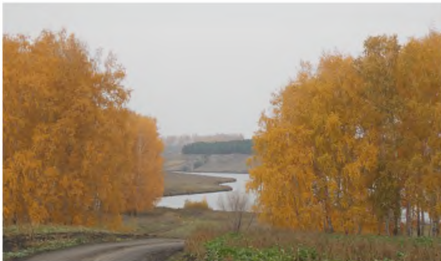
Осеннее утро. Фотография Бобровой Кристины 7 «А» класс

Позже наступит белоснежная зима, дальше свежая весна, а потом уже жаркое лето. И так пойдет за собой череда сезонов.