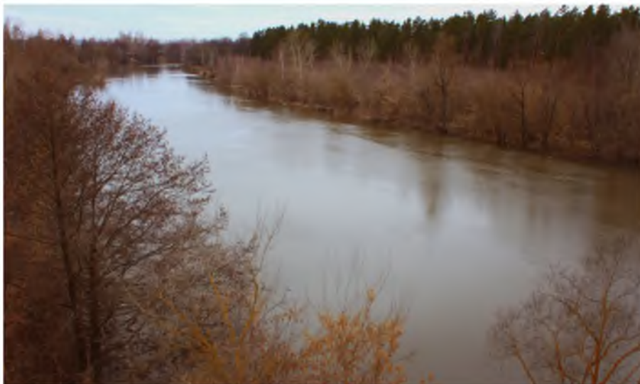
Река Ворона. Фотография Иванушкиной Лилии 7 «А» класс

Река Ворона — работага-река. Она умывает все берега, У неё долгий и трудный путь, Некогда реченьке передохнуть.