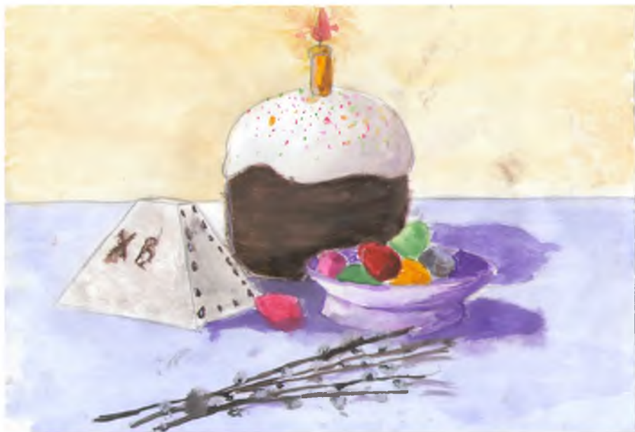
Рисунок Спиридонова Кирилла 7 «А» класс