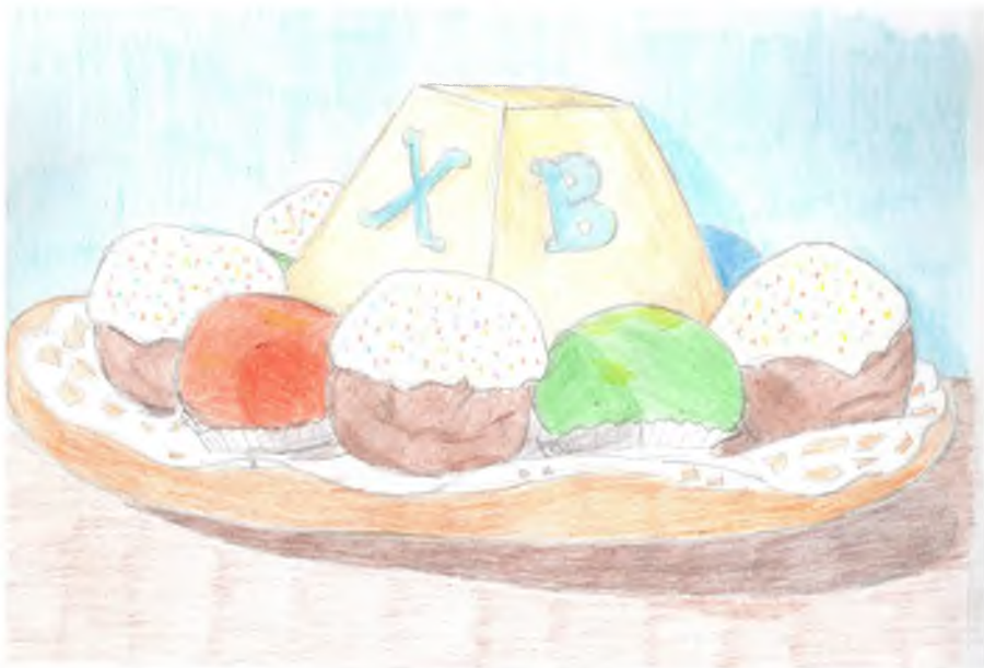
Рисунок Рыбалкиной Юлии 7 «А» класс