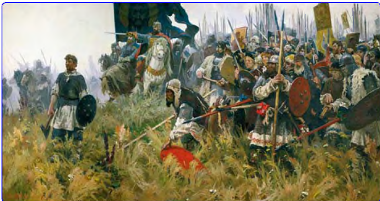
Утро на Куликовом поле. Художник А. Бубнов

преподобного Сергия Радонежского, который благословил князя и все русское войско на битву с иноземцами. Мамай же надеялся соединиться со своими союзниками: Олегом Рязанским и литовским князем Ягайло, но не успел: московский правитель, вопреки ожиданиям, 26 августа переправился через Оку, а позднее перешел на южный берег Дона. Численность русских войск перед Куликовской битвой оценивается от 40 до 70 тысяч человек, монголо-татарских – 100-150 тысяч человек. Большую помощь москвичам оказали Псков, Переяславль-Залесский, Новгород, Брянск, Смоленск и другие русские города, правители которых прислали князю Дмитрию войска.