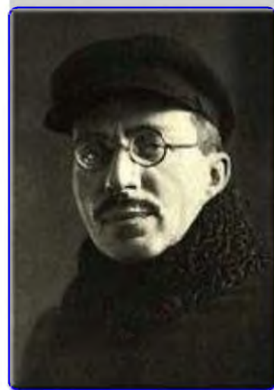
АНТОН МАКАРЕНКО ОПЕРЕДИВШИЙ ВРЕМЯ...

"Мы видели, что искусство обучения заключается не в умении сообщить, но в умении возбуждать, будить, оживлять. А как же можно возбуждать без возбуждения, пробуждать дремлющее без самостоятельности, оживлять без жизни? ... Это духовная жизнь, которая, разумеется, также отражается на лице [преподавателя], на всем внешнем облике и в жестах".