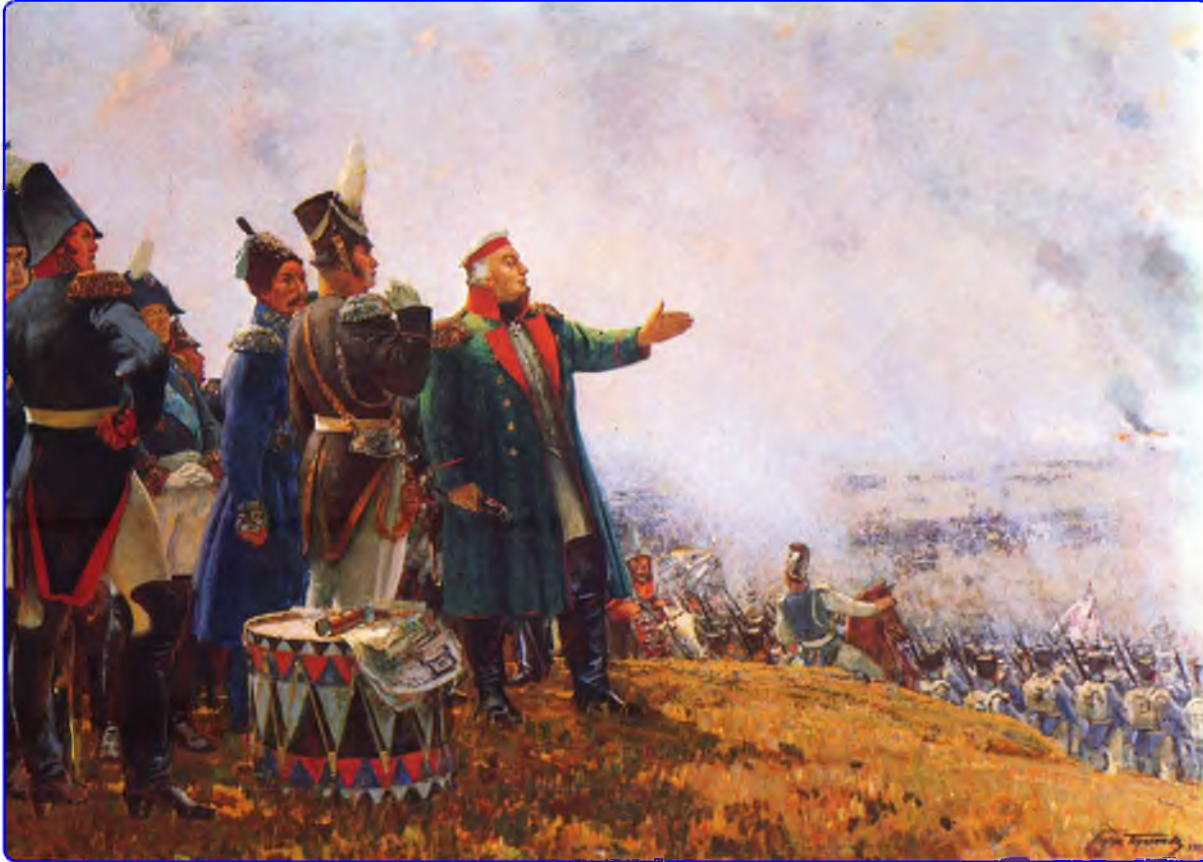
С.В. Герасимов. М.И. Кутузов на Бородинском поле. 1952 г.

Исторические события России постепенно забываются. Когда я проводила опрос ребят в школе, чем особенен 1812 год, они не смогли полностью ответить на этот вопрос. Я призываю людей знать и уважать историю своей страны. Я горжусь Россией, она не раз смогла отстоять свою независимость.