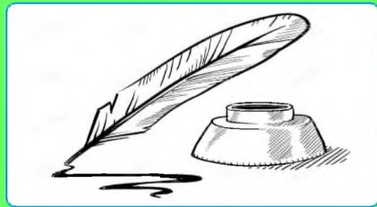
стр. 6 Литературная страничка