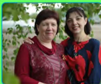
стр. 5 Быть может, династия продолжится?