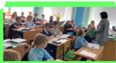
Стр. 3 Вернем престиж образованию