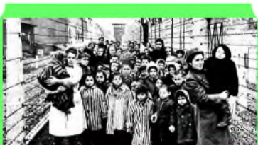
Стр. 4 Что такое холокост