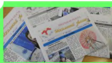
Стр. 5 С днём Российской печати