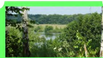
Стр. 6 Дать шанс природе