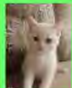
Стр. 6. Рыжие истории