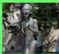
Стр. 3 Беслан