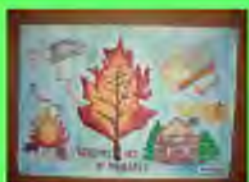
Стр. 2 С огнём шутить нельзя!