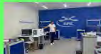
Стр. 5 Научимся управлять дронами