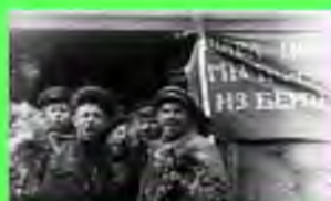
Стр. 4 Любить свою обитель - дело чести