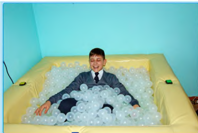
Вот оно счастье Фото Бородулиной Анастасии 7 "Б" класс