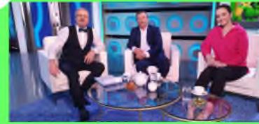
Стр. 5 Чудеса случаются