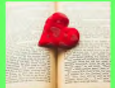
Стр. 6 О любви или Новый доктор