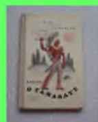
Стр. 3 Традиция дарить книги