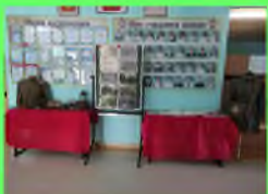
Стр. 2 О БЛОКАДЕ Ленинграда

Даниил Бахарев