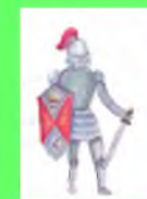
Стр. 6 Внимание!!! Проба пера