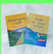
Стр. 3 Зачем мы учимся в школе