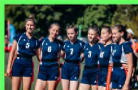
Стр. 2 Спортивные победы.

День учителя — это профессиональный праздник. Каждый ученик хотел бы поздравить своего учителя. Ведь это человек, который дает знания, путь в будущее. Дорогие наши Учителя, мы вас любим!!!