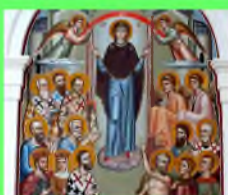
Стр. 4 Покров