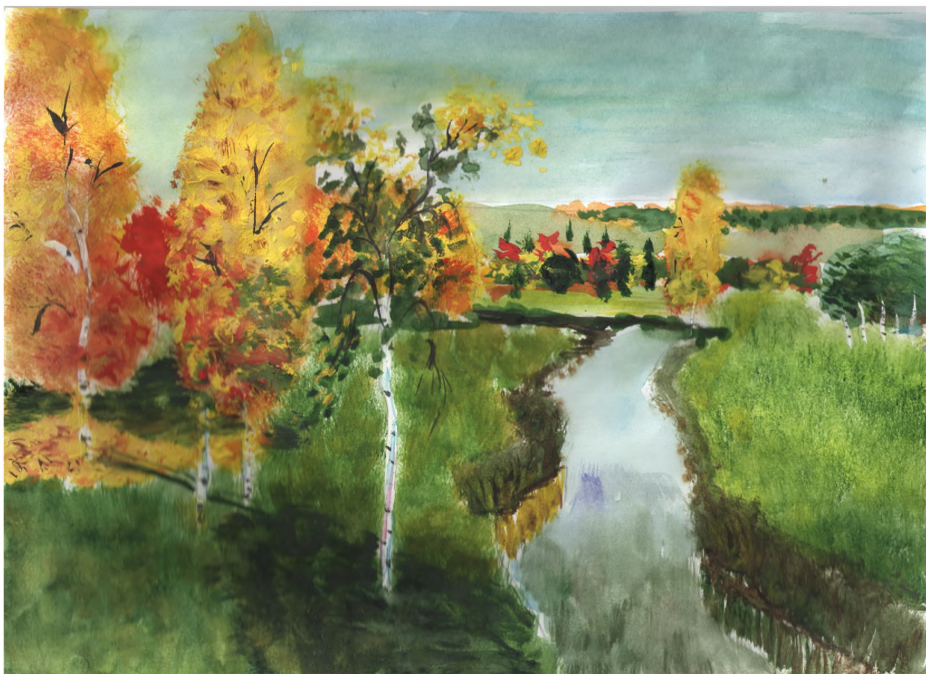
осенний рисунок Кирилла Спиридонова