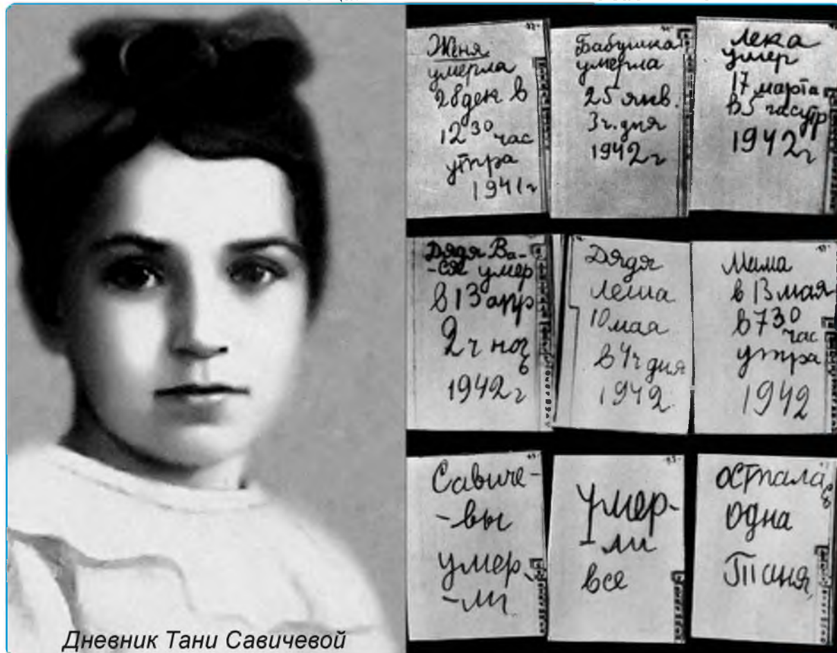
Дневник Тани Савичевой

А помнишь ту ужасную войну, Когда и взрослые, и дети погибали? Я расскажу, о чем вчера узнали. И так рассказ же мой начнётся. Блокада Ленинграда. Расскажу о том. Идёт война. Сидит девчонка дома. Сидит и плачет, в окна всё глядя. И пишет в старую тетрадку: «Одна, осталась я одна!» Исписанные карандашом страницы. Восемь листов. Все с описанием смертей. Читаю, в буквах вижу лица... «Умерла мама, дядя Лёша, Вася, И Женя умерла, и Лека, все! Осталась я одна, я Таня! Всё. И Тани нет теперь.» О тех погибших долго все молчали, Не замечали этих всех смертей! А вас я попрошу, увидьте люди! Заметьте смерть простых людей! И впредь не наполняйте мир страданьем, От этого он станет лишь темней.