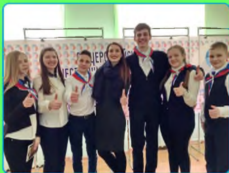
стр. 2 Вместе мы – сила

На сайте Министерства обороны Российской Федерации есть такие слова: «Долг, честь, служба Отечеству — вот главные составляющие мотивации военной службы». Они, как нам кажется, отражают современный взгляд на армию. И сегодня нам хотелось узнать, имеют ли отношение к армии наши учителя. Как выяснилось, имеют. Учителя физкультуры