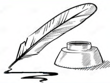
стр. 6 Литературная страничка