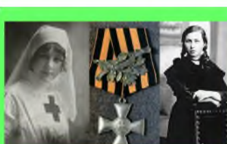
Стр. 4 Орден святого Георгия