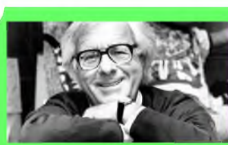
Стр. 3 В сетях виртуального мира