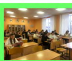
Стр. 5 Куда пойти учиться