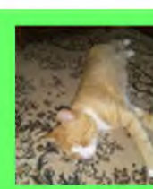
Стр. 6 Кошачьи истории