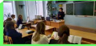
Стр. 5 Как стать полицейским