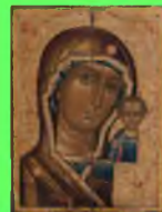
Стр. 4 Главная заступница Русской земли