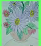
Стр. 6 Два цветка