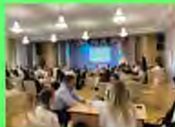
Стр. 2 Каникулы - отдых или работа?

Поздравляем ребят с первыми успехами в научной работе.