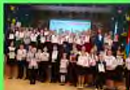
Стр. 4 Изучать историю интересно