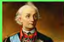
Стр. 3 Есть на кого равняться