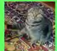
Стр. 6. Новогоднее чудо

Редактор: Анна Алипичева, Галина Павлова