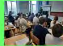
Стр. 5 "Современный урок - это прежде всего урок".