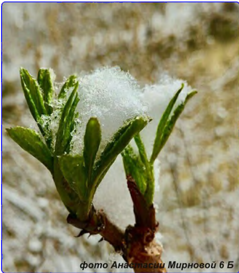
фото Анастасии Мирновой 6 Б