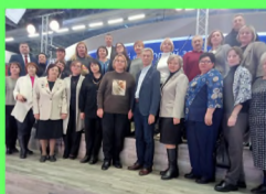
Стр. 2 Золотой запас России