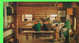
Стр. 5 Какие они - первые учителя?