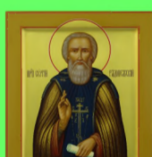
Стр. 4 Религия и образование