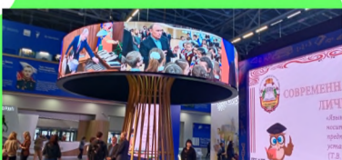
Стр. 3 Каким должен быть настоящий учитель?