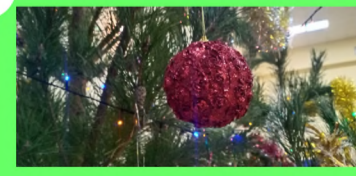
Стр. 6 Мой друг