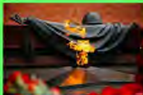
Стр. 4 Памяти жить в веках