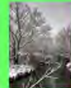
Стр. 6. Новогоднее чудо

Редактор: Анна Алипичева, Галина Павлова