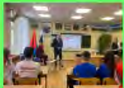
Стр. 2 О Дне Конституции