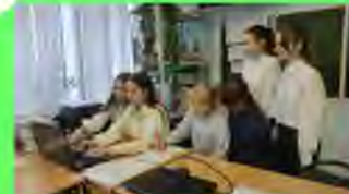
Стр. 5 Журналистика дружная семья