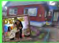
Стр. 3 Дом это место или люди?