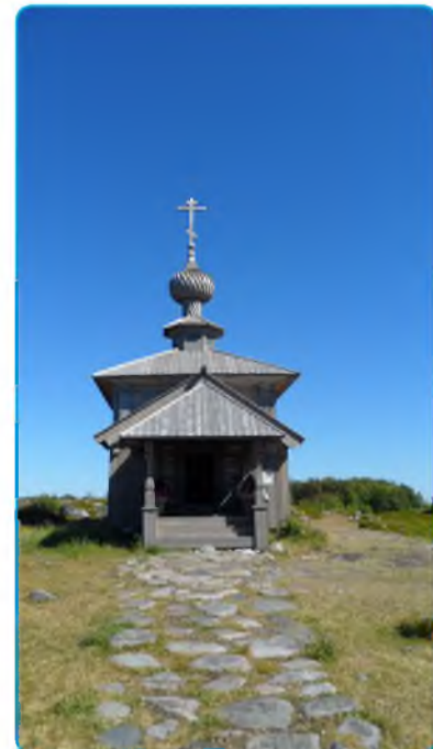
сохранились некоторые сооружения тех времён, свидетельствующих о судьбах тысяч мучеников лагеря.

Трагическими страницами в истории Спасо-Преображенского Соловецкого монастыря были 1923-1939 годы, когда на острове существовал лагерь для осуждённых советской властью. На Соловках