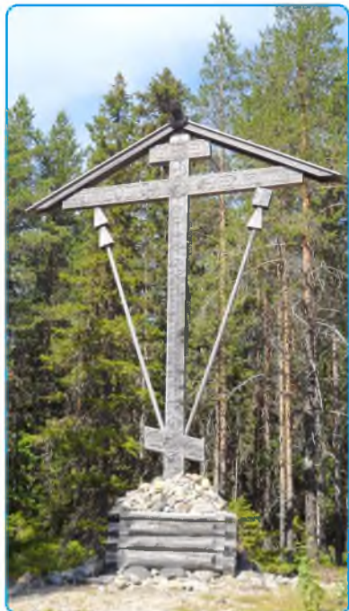
Еще об одной паломнической поездке