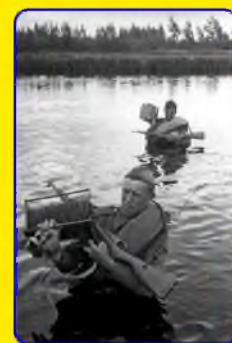
СТР. - 5. Профессии, без которых не обойтись