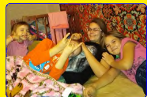
СТР. - 4. 15 мая Праздник: "Международный день семей"