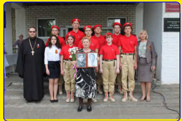
СТР. - 2. Месяц ПОБЕДЫ