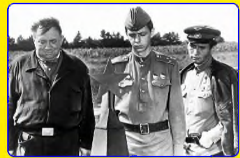
СТР. - 3. Немного статистики...