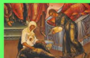
Стр. 5 От бабок-повитух до акушерки