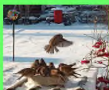
Стр. 2 Морозное утро