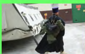
Стр. 4 Без Бога ни до порога