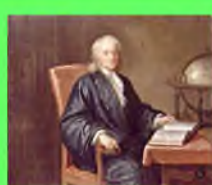
Стр. 3 Достояние человека