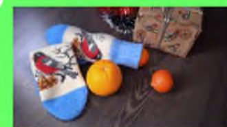
Стр. 6 Новогоднее чудо