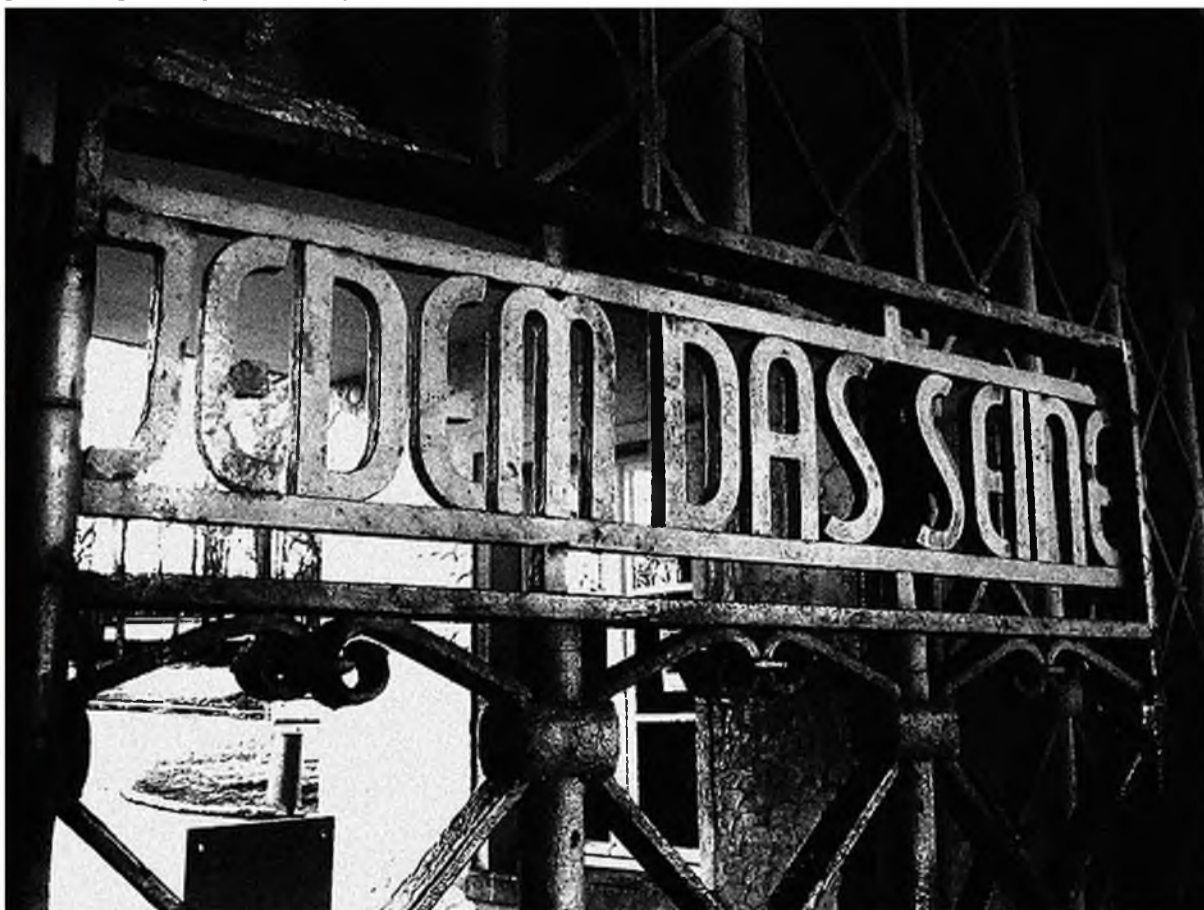
«Каждому своё» — надпись на входе в лагерь

Бухенвальду приблизились американские войска, в нём вспыхнуло восстание, в результате которого заключённые сумели перехватить контроль над лагерем у отступавших соединений СС. В память об этом событии был учреждён Международный день освобождения узников фашистских концлагерей.