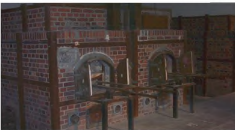
Печи лагерьного крематория