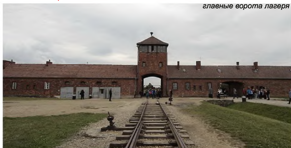
главные ворота лагеря

концлагерь Освенцим (Аушвиц). Над воротами лагеря видна известная вывеска-лозунг «Арбайт махт фрай» (Arbeit macht frei), что означает —