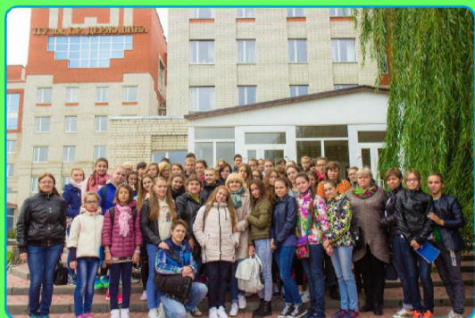
стр. 2 "Голос поколения 2016"

Пожелаем ей дальнейших успехов в таком нелегком преподавательском труде.