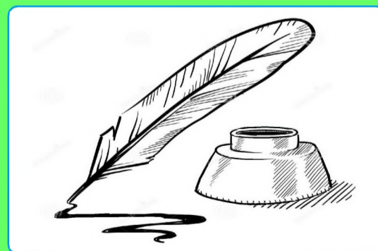
стр. 4 Литературная страничка