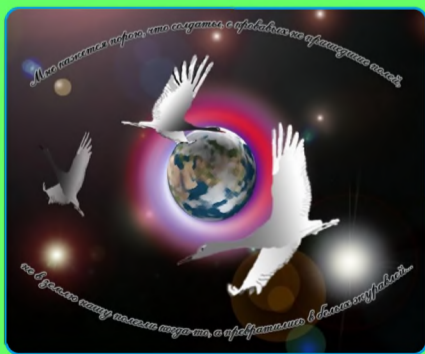
стр. 3 Праздник белых журавлей