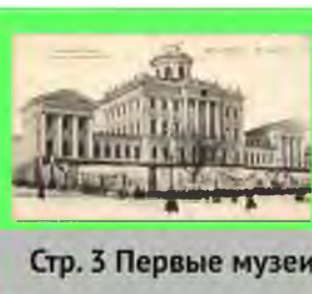
Стр. 3 Первые музеи