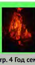
Стр. 4 Год семьи