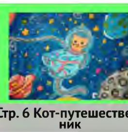
Стр. 6 Кот-путешественник