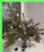
Стр. 2 Праздник к нам приходит