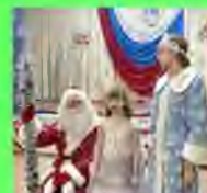
Стр. 5 Профессия Дед мороз