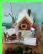
Стр. 3 Что такое Новый год