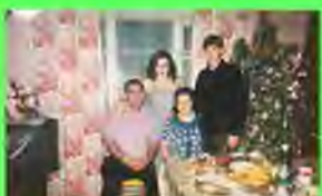
Стр. 4 К нам приходит Новый год