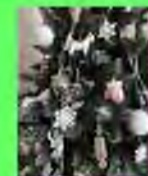
Стр. 6 Волшебный праздник