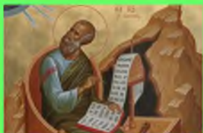
Стр. 4 Бог есть любовь