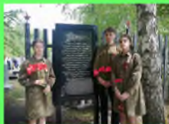
Стр. 2 Дни единых действий