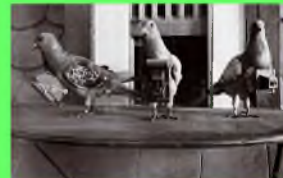
Стр. 5 Профессии ВОВ