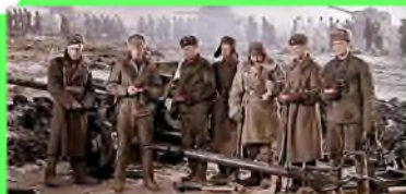
Стр. 3 Фильмы и книги