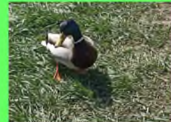
Стр. 6 Где-то здесь...