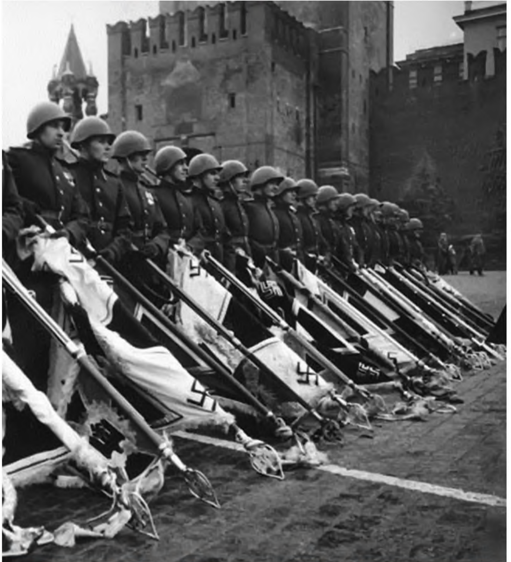
Страницы летописи бессмертного полка