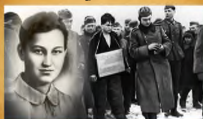
Не зарастет народная тропа...