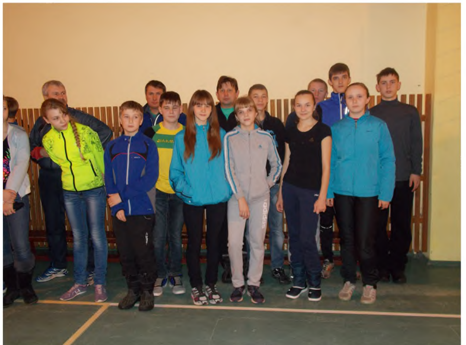
Команда Тамбовской области

3 этап VII зимней Спартакиады является финалом и должен состояться в городе Кыштым Челябинской области. По итогам 2 этапа в финал попадают 3 команды и по 6 участников, попавших в шестерку лучших в течение двух со-