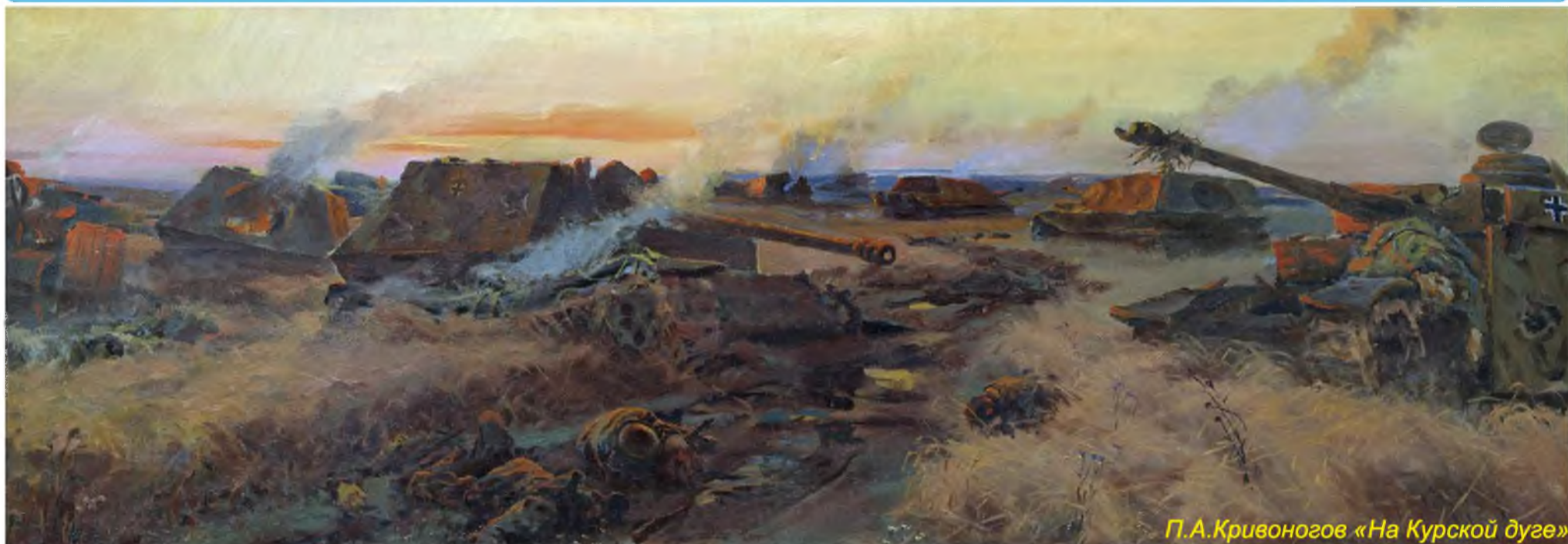
П.А.Кривоногов «На Курской дуге»

Просматривая в Интернете картины на военную тему, я нашла работу П.А.Кривоногова «На Курской дуге». Эта картина заворожала меня своим стойким патриотическим характером, который проявляется в битве могучих танков, поэтому я долго не могла оторвать от нее взгляда, полного пониманием жестокости и бесчеловечности войны. Художник настолько живо изобразил момент боя, что, кажется, я слышу и выстрелы пушек, и стоны раненых, и унывное завывание веттерка, опечаленного тем, сколько сыновей не увидит больше Россия-матушка. Проникшись чувства-