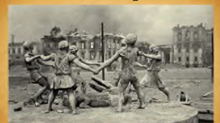
Экскурс в историю. Битва под Сталинградом