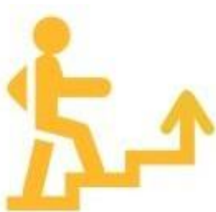
Логотип трека «Орлёнок – Лидер»

Ценности, значимые качества: команда, дружба